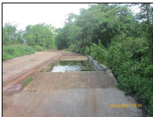
ภาพที่ 2.7 บ่อล้างล้อรถบรรทุกที่ขนส่งแร่