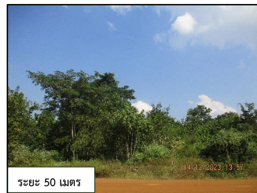
ภาพที่ 2.2 พื้นที่เว้นการทำเหมืองในระยะ 10 เมตร และ 50 เมตร