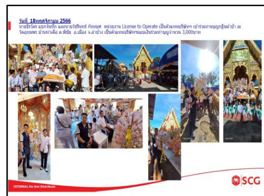
ภาพที่ 2.16 กิจกรรมการมีส่วนร่วมกับชุมชน