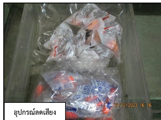
ภาพที่ 2.12 Stock อุปกรณ์ป้องกันอันตรายส่วนบุคคล