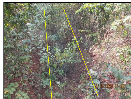
ภาพที่ 2.3 คั่นดินและคูระบายน้ำพื้นที่โครงการ