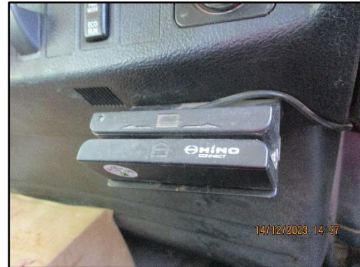
ภาพที่ 2.15 รถบรรทุกปิดคลุมผ้าใบและติดตั้งระบบติดตาม GPS