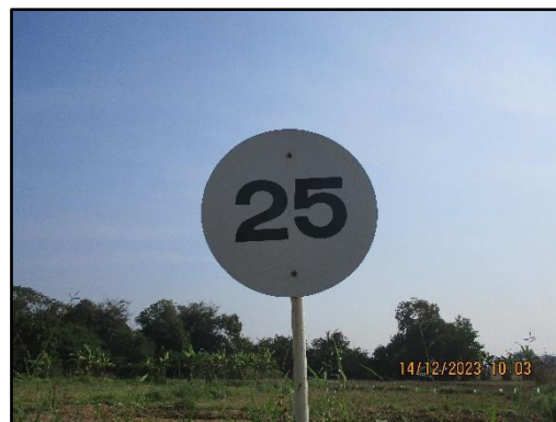
ภาพที่ 2.11 ป้ายจำกัดความเร็วไม่เกิน 25 กิโลเมตร/ชั่วโมง