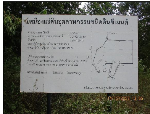
ภาพที่ 2.9 ป้ายประทานบัตร