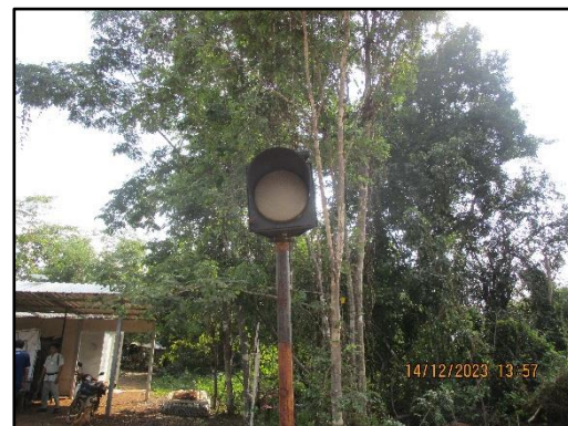
ภาพที่ 2.6 สัญญาณจราจรไฟกระพริบทางเข้า-ออกของพื้นที่โครงการ