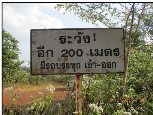
ภาพที่ 2.5 ป้ายสัญญาณจราจรมีรถขนส่งแร่เข้า-ออก ของพื้นที่โครงการ