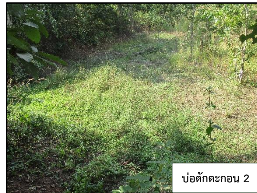
ภาพที่ 2.4 บ่อดักตะกอน 1 และ 2